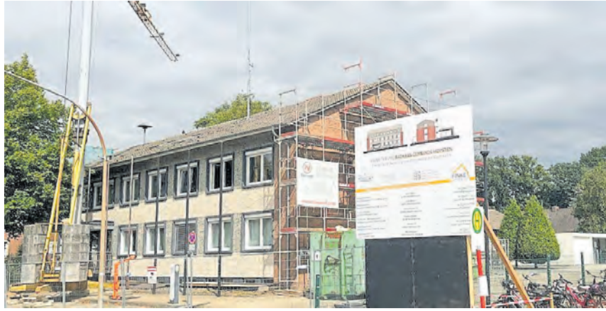
Die Umbauarbeiten (Erweiterung und energetische Sanierung) des Hopstener Rathauses sind gestartet.