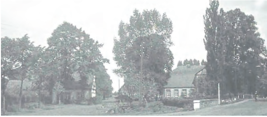
Das ehemalige Haus Müller musste in den 1970er-Jahren dem Neubau der Turnhalle weichen.