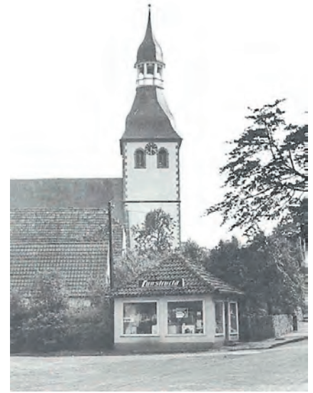
Altes Foto der St.-Georg-Kirche; im Vordergrund ein Haushaltsgerätegeschäft, das mittlerweile nicht mehr existiert.