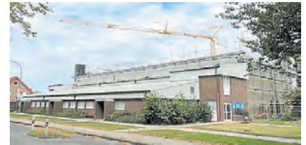
Die Dreifachsporthalle in Hopsten wird modernisiert.

Die Gemeinde Hopsten investiert mit dieser Maßnahme in die Zukunft ihrer Sportinfrastruktur und schafft zeitgemäße Rahmenbedingungen für Schulen, Vereine und Sportgruppen.