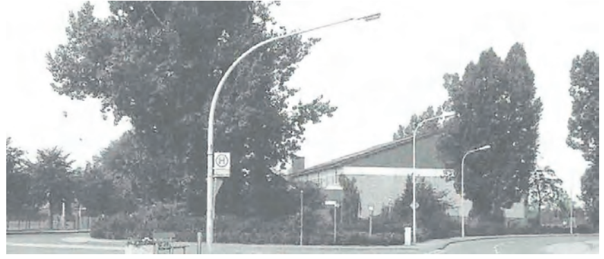
Die Sporthalle wurde in den 1970er-Jahren errichtet; in den 1990er-Jahren erhielt sie ein Satteldach, das bis vor Kurzem die äußere Gestalt prägte.