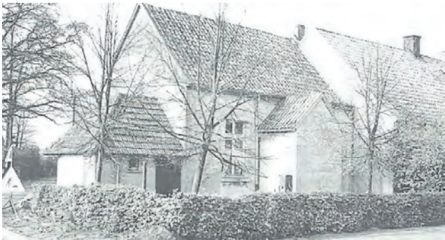
Hier ist noch die ehemalige Bucksat-Schule zu sehen; das Schulgebäude wurde später abgebrochen.

gern auf die bewegte Geschichte der drei Gemeindeteile zurückzublicken – diesmal mit Fotos aus Hopsten.