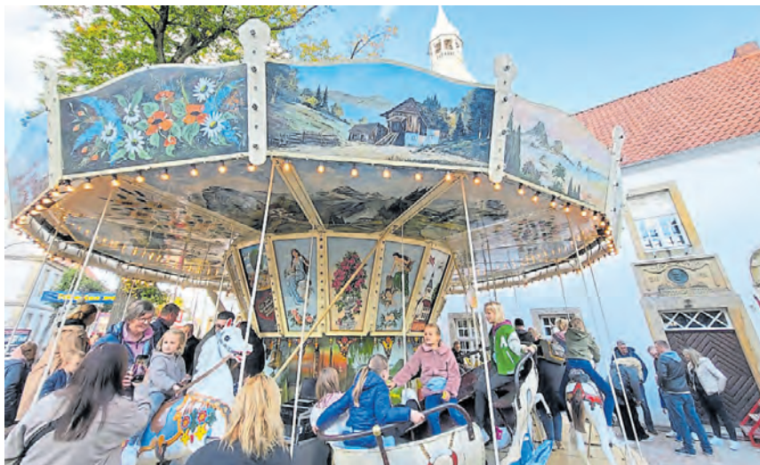
Fahrspaß und Tradition bietet auch diesmal die Hopstener Kirmes.

Nicht nur die Fahrgeschäfte locken: Auch für Sammlerinnen und Sammler gibt es Neues. Neben dem traditionellen Kirmes-Pin wird in diesem Jahr erstmals ein offizielles Kirmes-T-Shirt im Fanshop angeboten. Zudem gibt es auch diesmal am Pferdchenkarussell einen Fahrchip