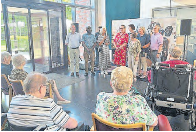
Das Team der Pfarrcaritas Hopsten war im Juli zu Gast im Anna-Stift.